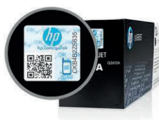
Hologramme sur cartouche de toner HP