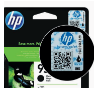
Hologramme sur cartouche d'encre HP