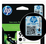
Hologramme sur cartouche d'encre HP