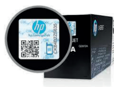
Hologramme sur cartouche de toner HP